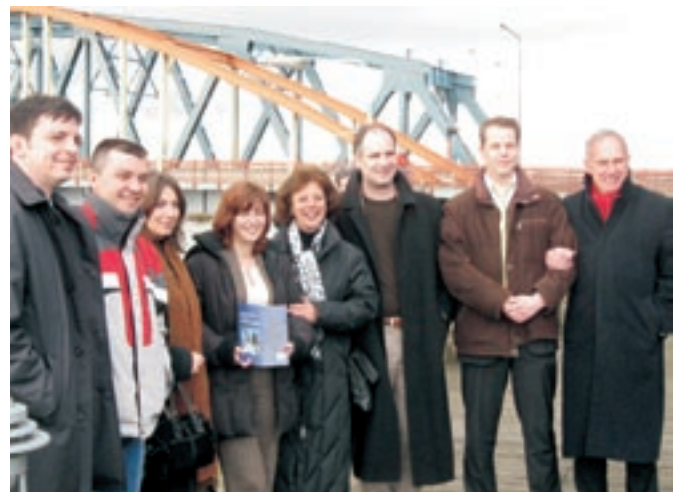
Visite à l'office Koos van Meggelen Zutphen – Visit to the Koos van Meggelen Zutphen office

The study visit appeared to be very successful. All participants were very satisfied. So it is only natural that also in future the close cooperation between UIHJ, the Dutch national chamber and the Bulgarian national chamber will continue.