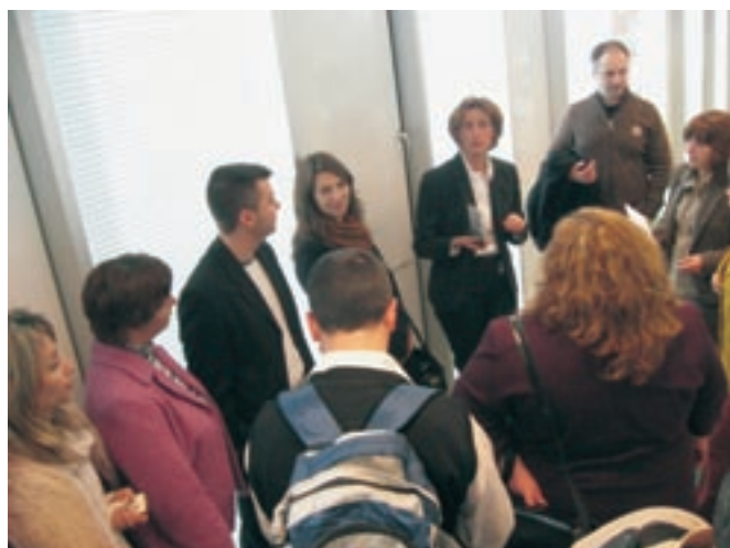
Visite à l'office Maas Delta (Rotterdam) – Visit to Maas Delta (Rotterdam)

Cette visite a indéniablement connu un grand succès. L'ensemble des participants se sont déclarés satisfaits. Il semble acquis que la coopération étroite entre l'UIHJ, la Chambre nationale néerlandaise et la Chambre bulgare va se poursuivre à l'avenir.