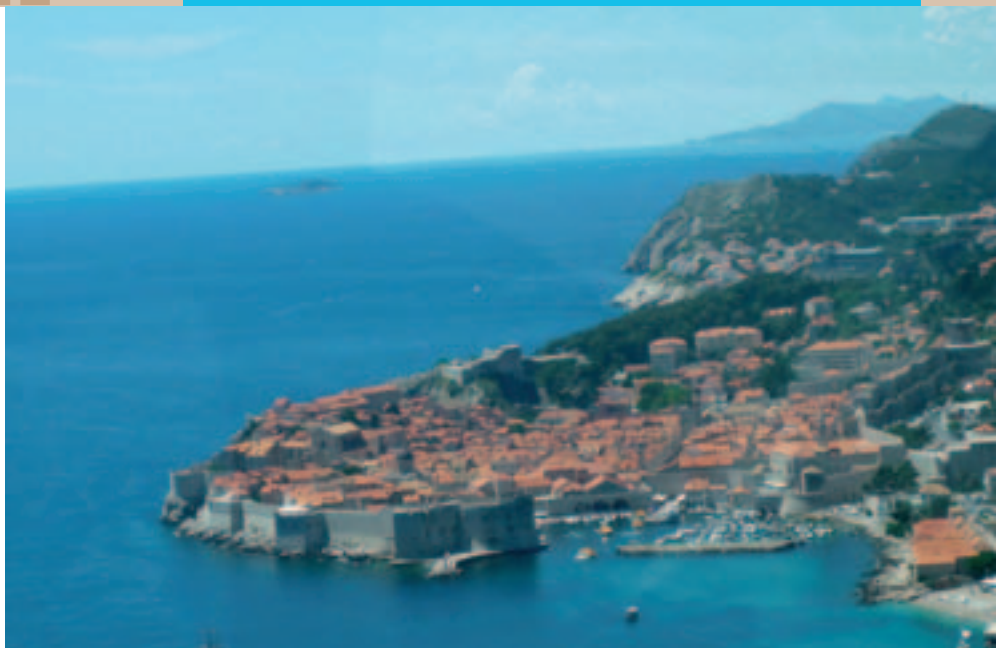
Une vue de Dubrovnik — A view of Dubrovnik

A representative of the ministry for justice of Croatia also came to present the work in progress in Croatia while Alan Uzelac drew a picture of the advantages to entrust enforcement of legal decisions to liberal judicial officers. In this respect, it seems from now a fact that this country, in its indefectible will to join the European Union as soon as possible, moves unrelentingly towards the installation of such a professional, as seems to prove the entire object of the Dubrovnik conference.