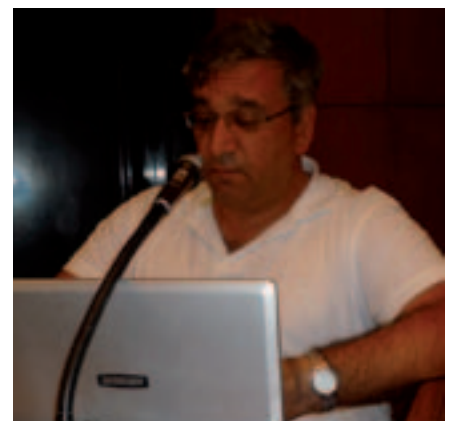
Antonio Kostanov, président de la Chambre nationale des huissiers de justice de l'ARY-Macédoine Antonio Kostanov, President of the National Chamber of Judicial Officers of the FYRO-Macedonia