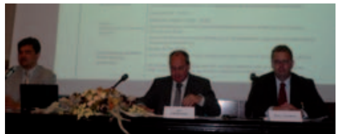
Ouverture du colloque international — Opening of the International conference