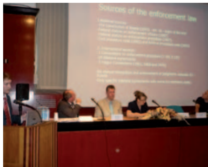
Intervention de la Fédération de Russie — Presentation of the Russian Federation